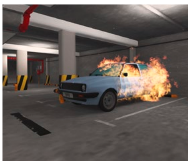
Fahrzeugbrand in der Einstellhalle